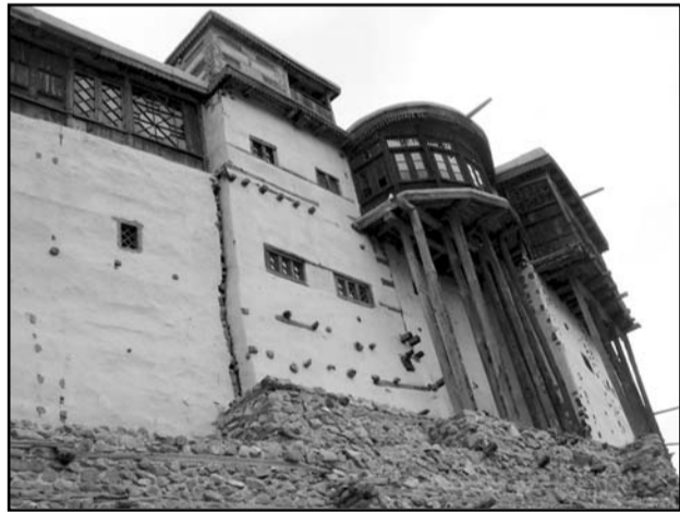
A Baltit erőd – középkori fellegvár a Hunza-völgyben

Ma 40 esztendeje veszett el karakorumi rokonaink országa. 1974 Föld (szeptember) hava 25.-e gyászos dátum – A Hunza állam megszűnése napja. Félezer éves főnállása után Hunzahont, a hunzák hegyi tündérországát az alig több, mint negyedszázados, kamasz Pakisztán lerohanta.