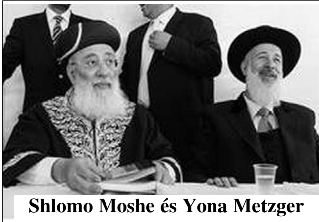
Shlomo Moshe és Yona Metzger

A továbbiakban kifejezik "félelmüket" a velencei eset kapcsán, ahol is "egy zsidó fiatal fizette meg az árát annak, hogy nyilvános helyen a jesiva iskolák diákjainak ruházatában jelent meg". Majd a két rabbi felszólítja az Európai Tanács elnökét arra, hogy hozzon létre egy különleges bizottságot, "amely megvizsgálja az antiszemitizmus kiterjedését a kontinensen,