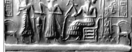
Naprendszerünk egy 4500 éves agyagtáblán

Természetesen nem tudjuk pontosan, hogy mi fog történni 2012. december 21-én, de amíg elérünk odáig, éljünk a jelenben. A világ jobbá tételét saját magunk önismeretével és tudatos változásával kezdhetjük. Ami lent, úgy fent, ami bent, az kint. A hópehely sem gondolja úgy, hogy felelős lenne a lavináért, de mégis az.