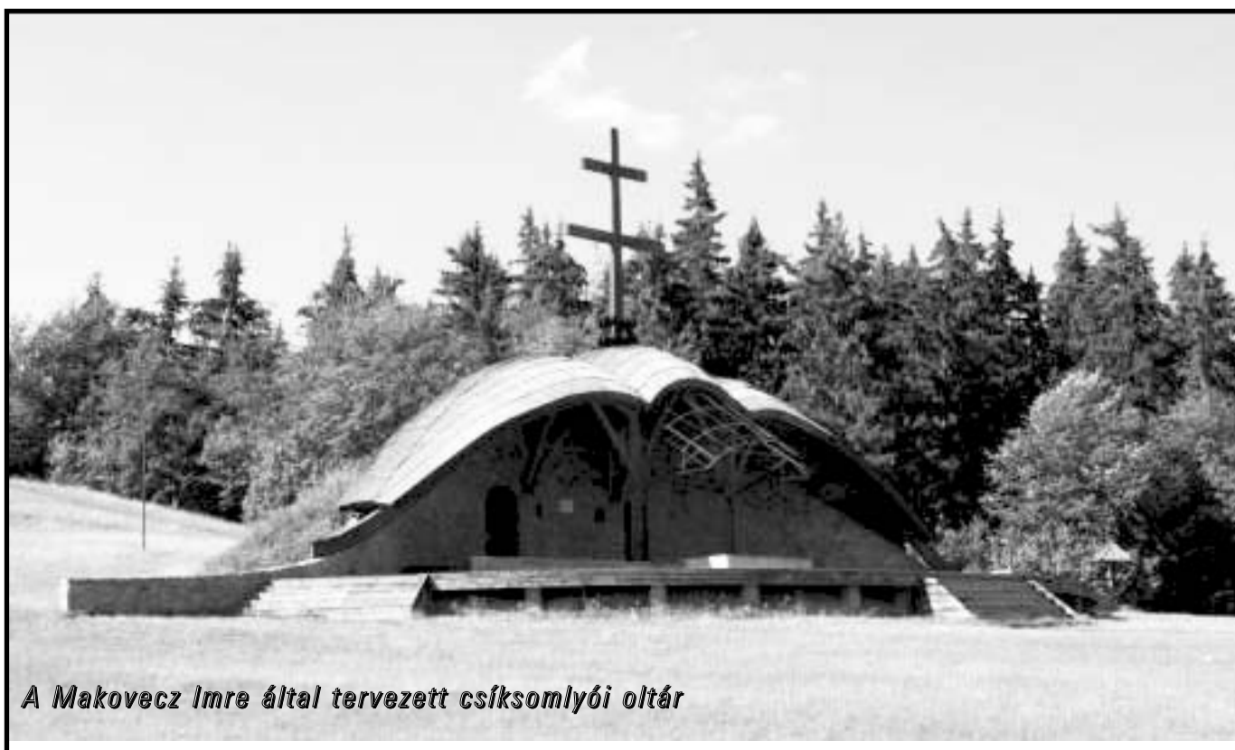
A Makovecz Imre által tervezett csíksomlyói oltár