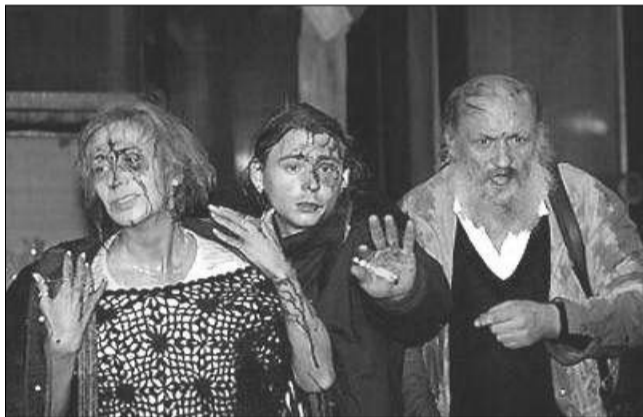
6. ábra: Megvert magyar tüntetők, 2006 ősz.

1986-ban jelenik meg a NATO Akadémiának egy görög nevű professzorától egy könyv /2/, amelyben a földközi tengeri országok geopolitikai szerepét tárgyalja. Izraellel kapcsolatban kifejti, hogy az olaj kifogyásával párhuzamosan fog csökkenni szerepének fontossága és a nemzetközi támogatás is. Az akkori fogasztási szokásokat tekintetbe véve az utolsó csepp olaj kiszippantásának idejét is megadja: 2032-2034 között. Ekkor legkésőbb Izrael geopolitikai szerepe a térségben megszűnik és a hatalmas arab nyomás alatt Izrael összeomlik. Mint a NIF (Nemzeti Internet Figyelő) egyik helyén már említettem a Perzsa Öböl partján alkoholmentes dinnye koktélt iszogotva jelentette ki egy arab diplomata: „A Vörös Tenger ki van sápadva! Zsidó vérrrel fogjuk újra festeni!” A gyűlölet Izrael ellen Egyiptomban is tetten érhető és minden egyes arab országban, még a legamerikabarátibb országban is. Hisz mindenki ismeri az elfoglalt területek betelepítési módszereit. Külön disszertációban foglalkoztak vele /3/.