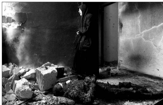
7. ábra: Palesztin anya síratja a bombázásokban szénén égett fiát

Csak egy példát ragadjunk ki ebből: USA műholdjai segítségével pontosan megállapítható, hogy egy palesztinok által lakott város milyen földalatti erekből kapja a vizet és ezek merre vannak. Megjelenik a város körüli sivatagban egy hordozható fűtorony és katonai védelem alatt megfűrik az eret. Harc nélkül a város 1 hét alatt kiürül. 1-2 év várakozás után be lehet telepíteni az újabb galíciái bevándorlókat. De az izraeli hadsereg kegyetlenkedései ettől sokkal csúnyábbak, hisz a menekült táborokba kényszerített izraeli lakosokat pilóta nélküli repülőgépekből, távirányítással lövik.