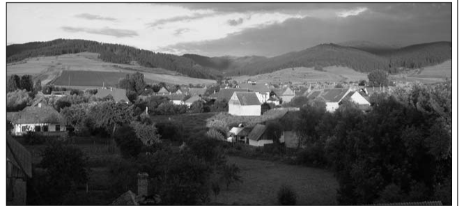
10. ábra: Szép hazánk, a Kárpátmedence: Csík-szentmárton

Íme, hová küldheti kérdéseit ill. kommentárt a cikkkel kapcsolatban: