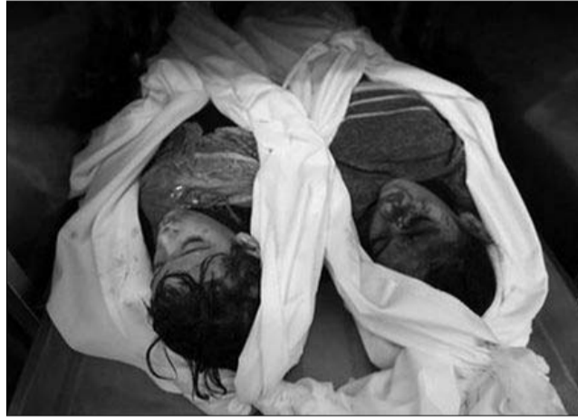
8. ábra: A cionista álom a megvalósítás útján Palesztin menekülttábor támadás után: meggyilkolt gyerekek

Mert Izrael egy generációt már nem fog kibírni a Közél-Keleti térségben. Kell az izraeli zsidóságnak az élettér, és ehhez pedig egy akkora térszta, a megfelelő kovázzsal, mint az EU nagyon jól jön. És ezen belül is Magyarország a leginternáciobb hely. Ennek ellenére mégis Magyarországot szidják, ahelyett, hogy pl. Svájcjal foglalkoznának, ahol a mecsetek ellen szavazott az ország nagy része és valóban érezhetően nő a nacionalizmus, sovinizmus és rasszizmus.