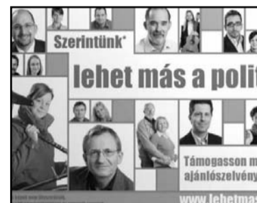
„lehet más a politika”