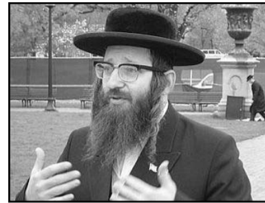
És egy kis "bazai", akinek Trianon kapcsán is a holokauszt jut eszébe: