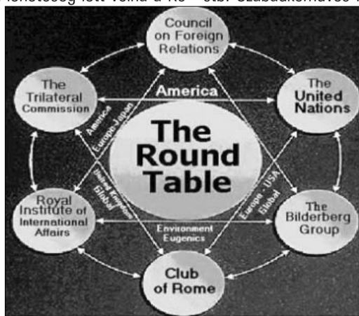
A Round Table hiányos elágazásokkal

Az illuminátusság és a sza- badkőművesség mögött ártatlannak tűnő jótékonykodó segélyszervezetek emberbaráti lánc húzódik, akárcsak a különböző nemes lovagrendeké, adako- zó kluboké, sejtelmes egyházaké, tudománycsoportoké, nemzetközi tanácsoké, gyanús, de jól hangzó elnevezéssel bíró értelmiségi társaságoké, - ne tévessze- nek meg senkit, többségük az előzőek udvarához tartozik, azok eszköztárához. (Ujsághír 2009.02.09-én.: „A Jeruzsále- mi Szuverén Máltai Lovagrend uralkodó nagymestere a Rend nagykeresztjét adományozta az Országházban Gyur-